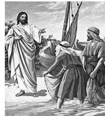
The First Disciples

19-та неділя по П'ятидесятниці. Голос 2 19th Sunday after Pentecost. Tone 2