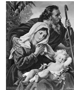
The Escape to Egypt