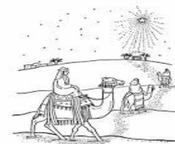
THE JOURNEY OF THE MAGI

There were three wise men in the East, who read the message of the Baby Jesus' birth in the sky. They followed the wondrous star to where the Baby lay.