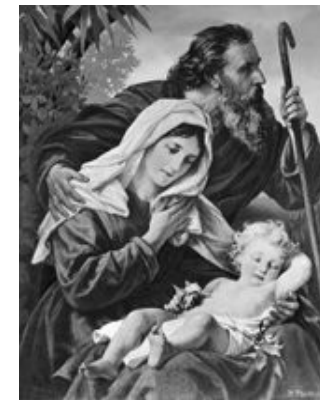
The Escape to Egypt

31-а неділя після Пятидесятниці. Голос 6. 31st Sunday after Pentecost. Tone 6.