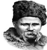
Тарас Шевченко (1814—1861)

SUNDAY OF ORTHODOXY - VESPERS will take place in St. George Greek Orthodox Cathedral (4500 Arbutus St. Vancouver, BC) today at 7:00 pm. Please attend this special, annual service with the participation of all Orthodox parishes, celebrating our faith and our Orthodox community in Greater Vancouver. After the Service there will be a reception for all participants.