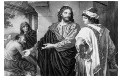
The Rich Young Ruler

12-та неділя по Пятидесятниці. Голос 3. Успенський Піст 12th Sunday after Pentecost. Tone 3. Dormition Fast (Theotokos)